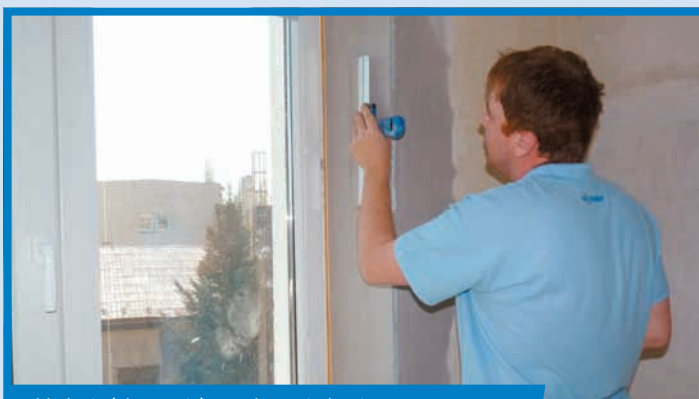
Vyhľadanie (gletovanie) povrchu omietky Rimano UNI

Po zavädnutí, teda pri dotyku prstami ruky, už neostávajú stopy v omietke, plochu navlhčíme rozprašovačom s vodou. Následne dlhými ťahmi penovým hladidlom prejdeme celú plochu omietky na špalette.