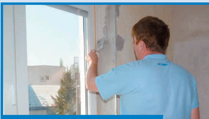
Nanesenie Rimana UNI na špaletu

Na samotné osadenie rohovej lišty si namiešame dostatočne hustú omietku. Nanesieme ju na roh špalety, čím si ho pripravíme na vloženie rohového profilu. Do nanesej omietky vložíme rohovú lištu a zarovnáme do hrúbky omietky na murive a na rovinu APU lišty na ráme okna. Oba profily osádzame veľmi starostlivo s ohľadom na zvislosť a rovinnosť špalety.