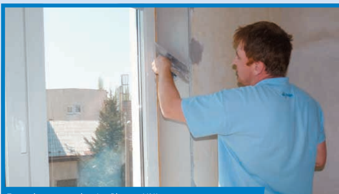
Zrezanie nanesej vrstvy Rimana UNI

Nanesenú vrstvu vyrovnáme nerezovým hladidlom, prípadne krátkou hliníkovou H-latou krátkymi zvislými ťahmi od okenného rámu po rohovú lištu.