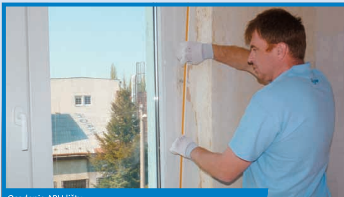
Osadenie APU lišty