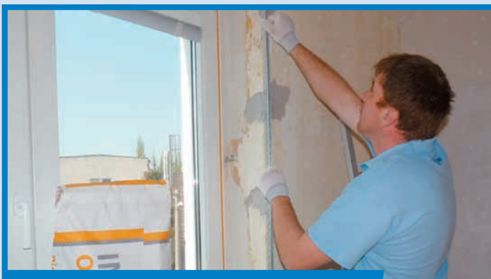
Osadenie rohového profilu