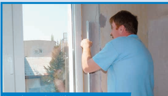
Vyrovnanie nanesej vrstvy H-latou

Na špaletu nanesieme (príp. vtlačíme murárskou lyžicou) omietku a vrstvu zarovnáme podľa APU lišty a rohovej lišty. Naraz môžeme naniesť vrstvu až s hrúbkou 30 mm, prípadne i viac, 40 – 50 mm. V prípade potreby nanesieme druhú vrstvu ihneď po zatuhnutí prvej.