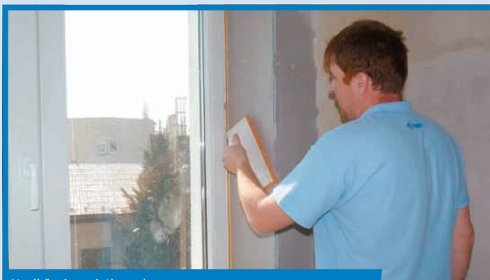
Navlhčenie omietky vodou